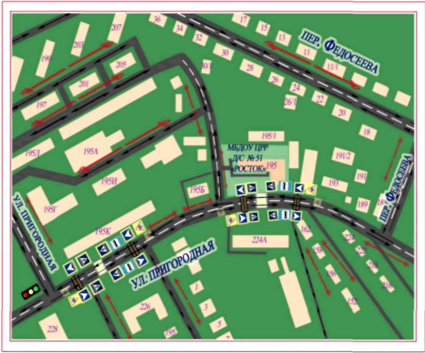
СХЕМА ОРГАНИЗАЦИИ ДОРОЖНОГО ДВИЖЕНИЯ В БЛИЗИ МБДОУ ЦРР д/с № 51 «РОСТОК» С РАЗМЕЩЕНИЕМ СООТВЕТСТВУЮЩИХ ТЕХНИЧЕСКИХ СРЕДСТВ, МАРШРУТЫ ДВИЖЕНИЯ ДЕТЕЙ И РАСПОЛОЖЕНИЕ ПАРКОВОЧНЫХ МЕСТ